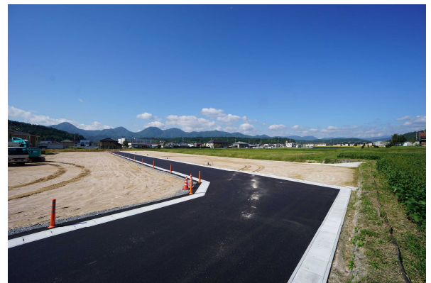
※イメージ ご期待ください!

セブンイレブンまで徒歩 1分 八重小学校まで徒歩 12分 千代田中学校まで自転車で 7分 アルゾまで車で 2分 サンクスまで車で 3分 郵便局まで車で 3分