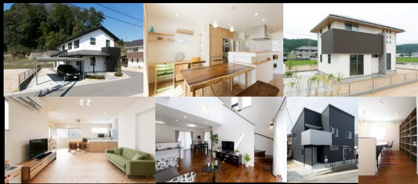
※写真は弊社施工事例です。