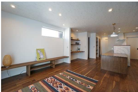
ゆったりとしたリビングスペースは、作り付けのTV台や机など、統一感があってオシャレ。