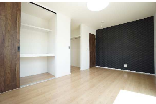
2階の居室は、各部屋ともアクセントカラーのクロスでオシャレに。たっぷりの収納も魅力。