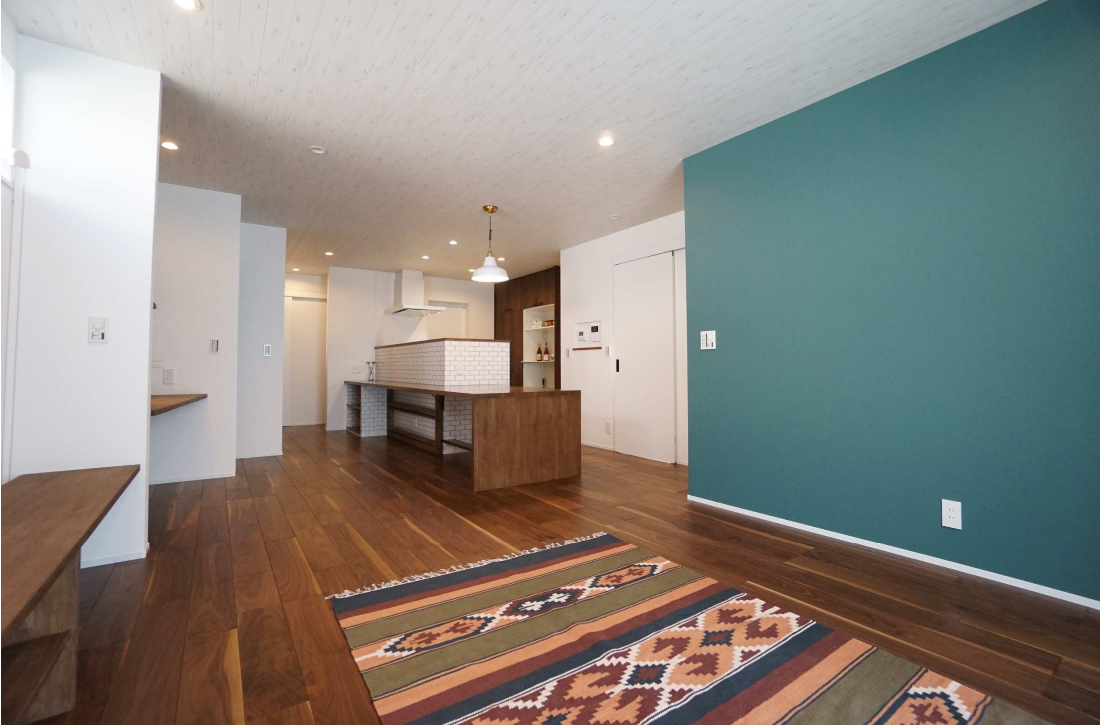
クラシックな印象の床材と、ナチュラルヴィンテージ風内装で個性的で落ち着いた雰囲気のあるLDKは、いつまでもここに居たくなる家族の寛ぎ空間に。