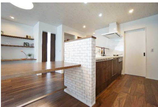
キッチン周りに造作したダイニングテーブルは、カウンターと一体型でスマートに。