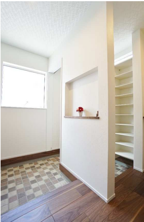
家族の靴をたっぷり収納でき、ベビーカーも置けるエントランスクロークを備えた玄関